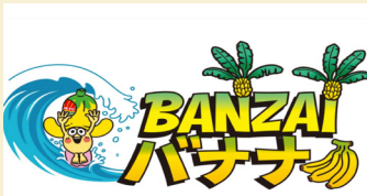
BANZAI バナナ のむバナナ バナナスムージー