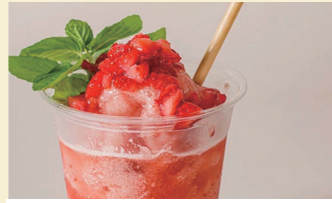
IZAKAYA HANAYA イチゴシャーベット