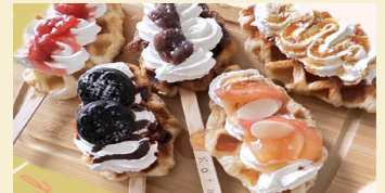
Kitchen Car Kota フルーツサンド