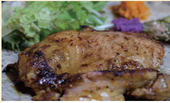
シーサイドカフェブルートリップ ジャークチキンサンド