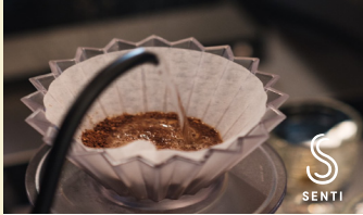
SENTI COFFEE コーヒー