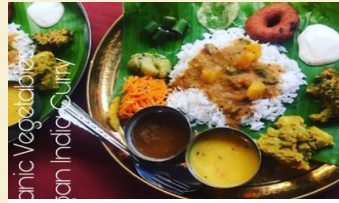
アイタル食堂 ヴィーガンインドカレー