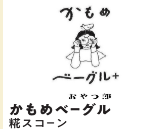
おやつ部 かもめベーグル 糎スコーン