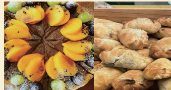
Lekkernijen たまちゃん商店 キッシュ、タームパイ、焼菓子 (ヴィーガン、グルテンフリー含む)