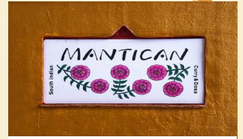
MANTICAN やんばる若鶏のチキンビリヤニ