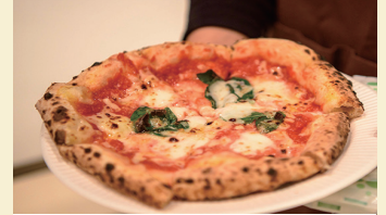
ミルコの琉球ピッツァ マルゲリータ